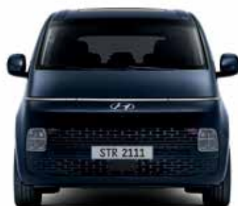
Largeur totale 1 997 Bande de roulement 1 721