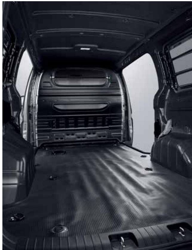
Espace de chargement fourgon panneau 3 places