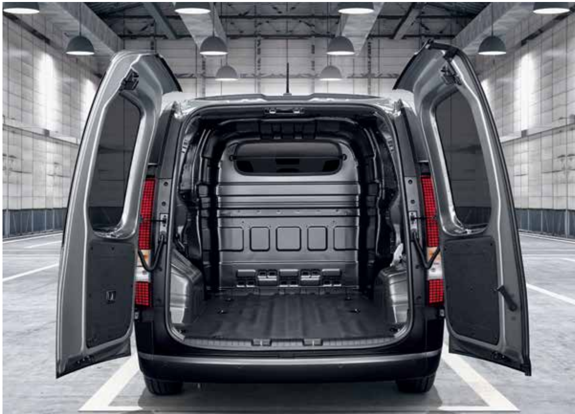
Doubles portes battantes