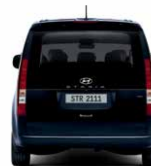
Bande de roulement 1 732