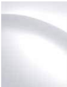
Creamy white (YAC)