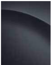
Graphite gray metallic (P7V)