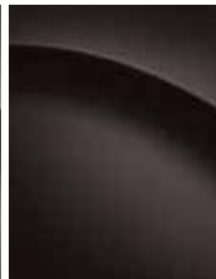
Gaia brown pearl (D25)