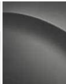
Olivine gray metallic (X5R)