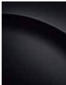
Abyss black pearl (A2B)