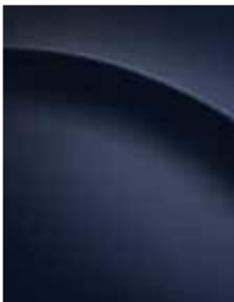
Moonlight blue pearl (UB7)