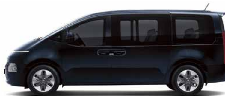
Longueur totale 5 253 Empattement 3 273