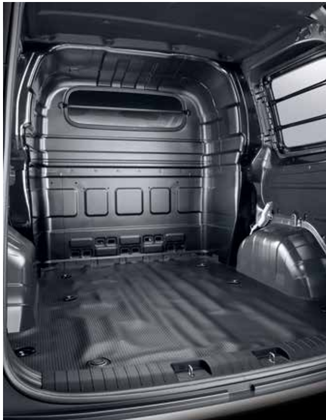
Espace de chargement fourgon vitre 5/6 places